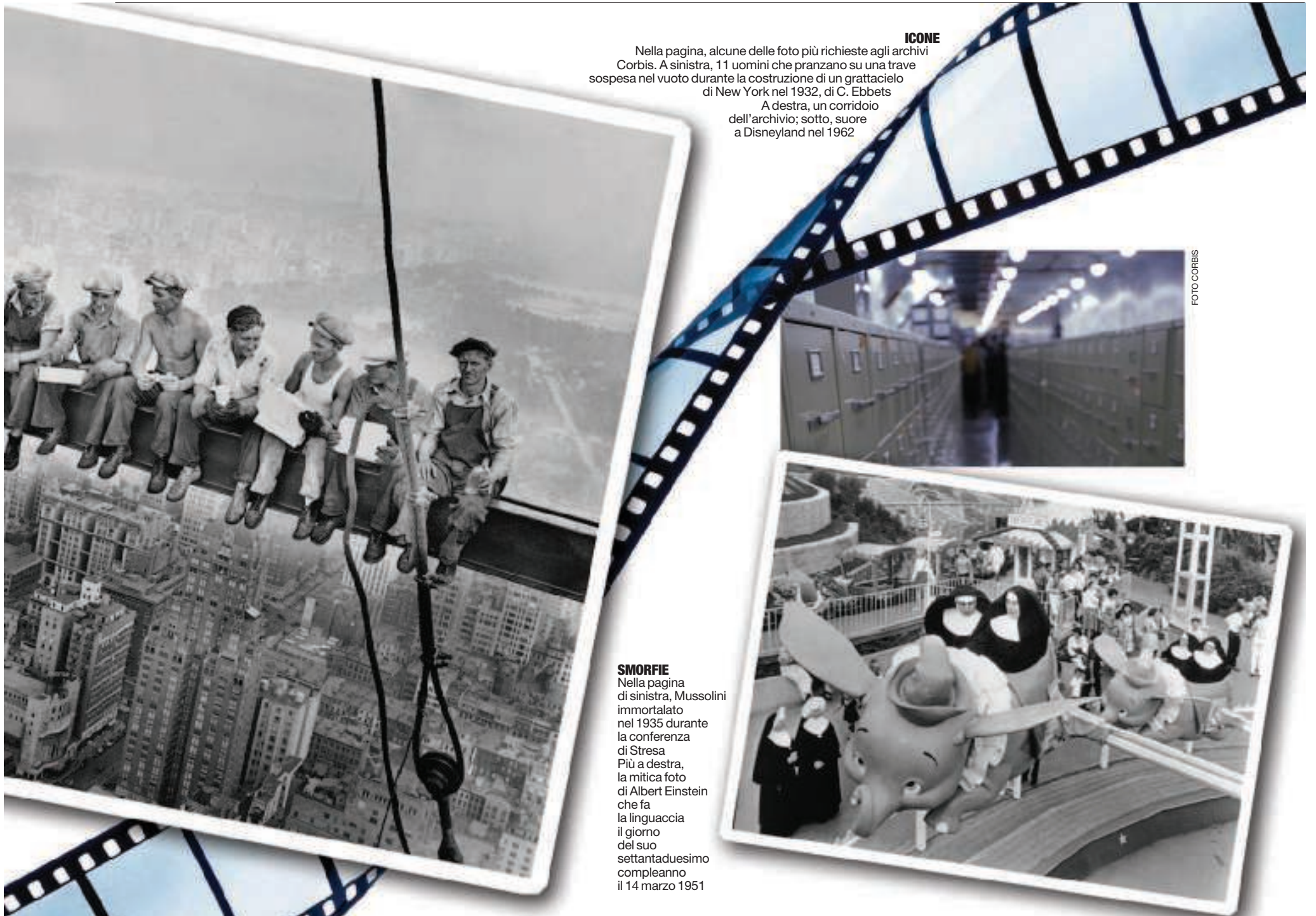
ICONE Nella pagina, alcune delle foto più richieste agli archivi Corbis. A sinistra, 11 uomini che pranzano su una trave sospesa nel vuoto durante la costruzione di un grattacielo di New York nel 1932, di C. Ebbets A destra, un corridoio dell'archivio; sotto, suore a Disneyland nel 1962